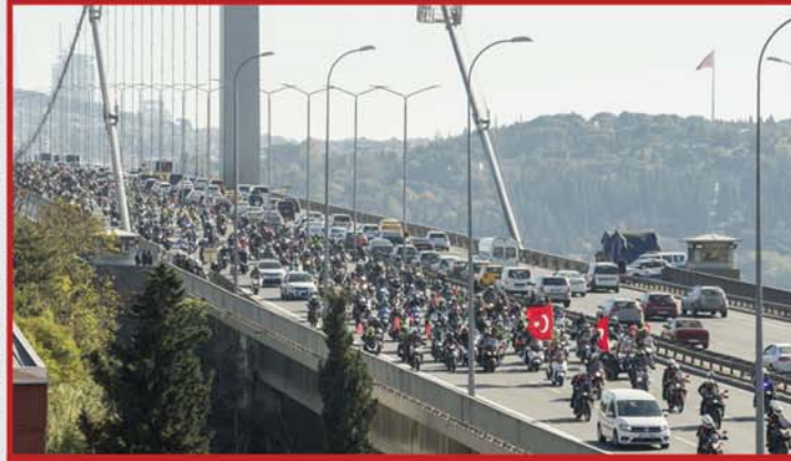
İstanbul'da binlerce motorcu bir araya geldi...