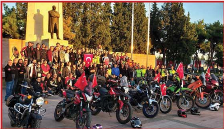
Balıkesirli motorcularımız saygı duruşunda...