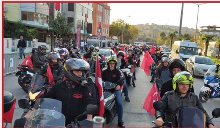
Balıkesirli motorcularımız kortej de...