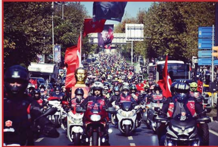
Cumhuriyet evladı olmanın gururu...

MKSF Motosiklet Kullanıcıları ve Sporları Federasyonu, Motosiklet platformu, ve onlarca motosiklet dernek kulüp yurdun bir yanında Cumhuriyetimizi kutladı. Ama ne kutlamak. Yurdun dört bir yanında ki motorcular motosikletleri ile kortejler oluşturdu. Bu artık bir gelenek. Gittikçe yıllar geçtikçe katılım ve coşku daha da arttı.